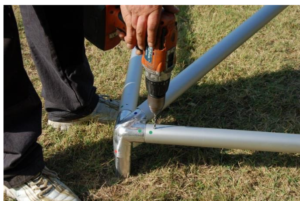
Percer les trous diamètre 5mm (les barres sont pré percées).