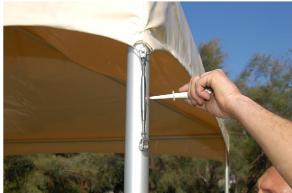
Commencer à mettre en tension les tendeurs, utiliser un tournevis pour cette opération.