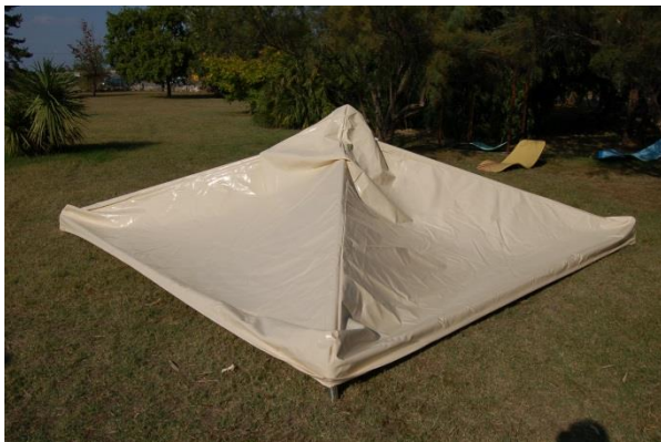
Poser la bâche sur l'armature.