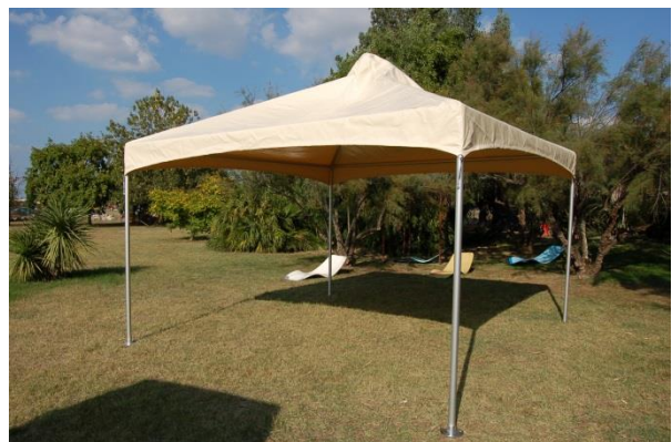
Enfiler les 2 autres pieds, il est préférable d'effectuer cette opération à 2 personnes.