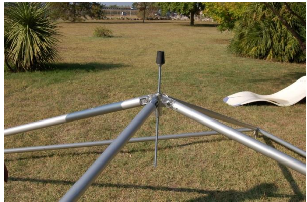
Insérer la tige de tension par le dessus.