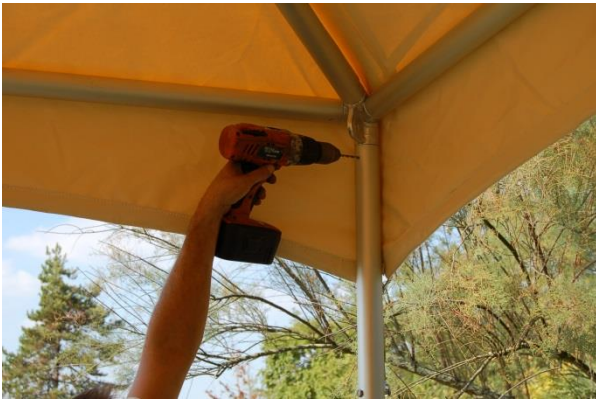
Percer et riveter les pieds (les barres sont pré percées).