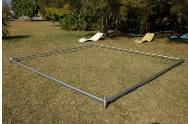
Assembler le cadre haut à l'aide des barres transversales et noix d'angles.