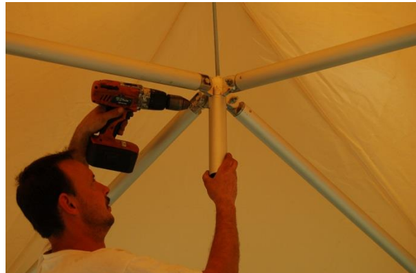
Percer et riveter le tube d'habillage de noix.