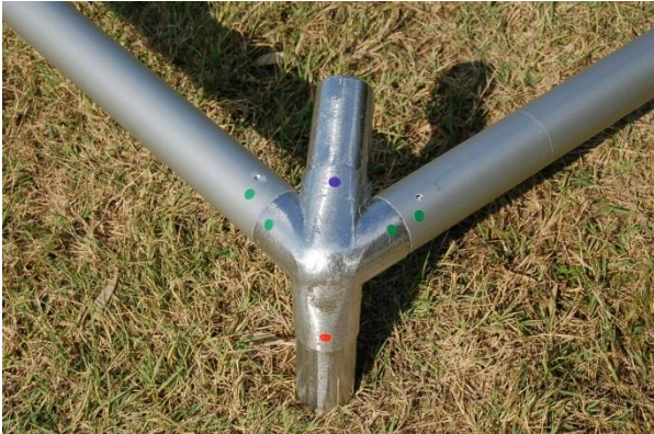
Assembler suivant les pastilles de couleur.