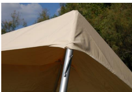
Tendeur inox aux pieds