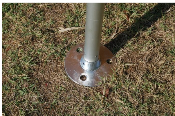
Il est nécessaire de fixer les pieds au sol.