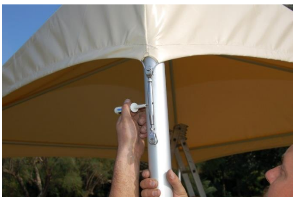
Finir la tension des 4 côtés