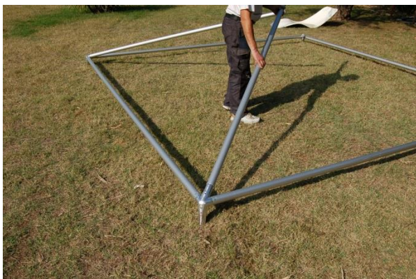
Assembler les barres d'arêtières.