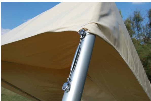
Attacher les tendeurs sans les tendre.