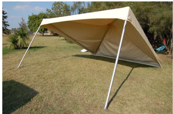
Enfiler les 2 premiers pieds, il est préférable d'effectuer cette opération à 2 personnes.