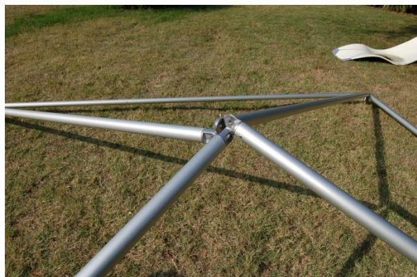
Les embouts de noix sont déjà montés sur les barres.