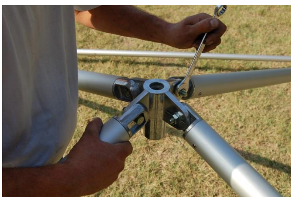
Assembler la noix de faitage.