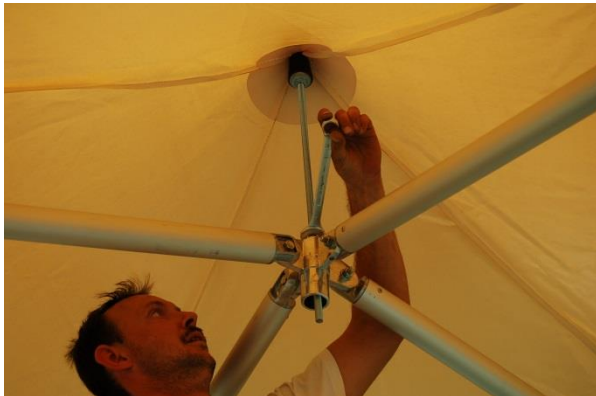
Mettre en tension le faîtage à l'aide d'une clef de 19.